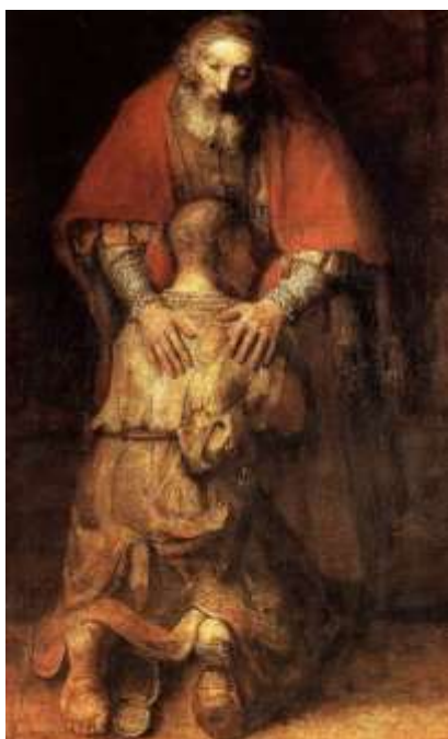
Il padre misericordioso di Rembrandt

Verso la Cripta, nel Santuario Antico, per partecipare alla Celebrazione Eucaristica